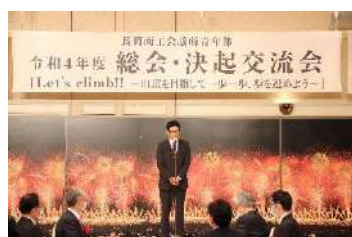
4/20 青年部「総会・決起交流会」