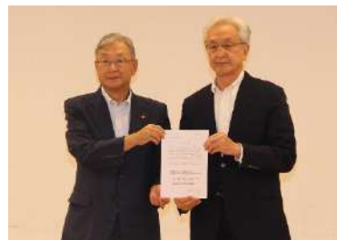
長岡市：磯田市長へ要望