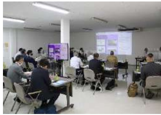
9/1 機械・電機部会視察会 株式会社遠藤製作所