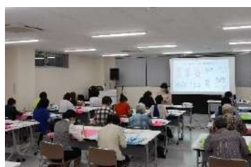
9/8 女性会「伝筆ミニセミナー」