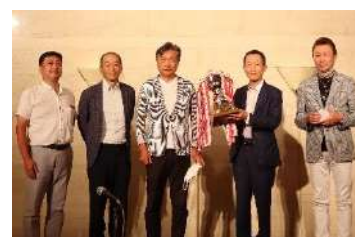
9/10 ゴルフ大会「表彰式」