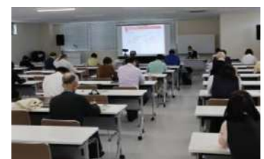
4/21 インボイスセミナー

■東京商工会議所との連携によるオンライン研修講座により、お得な会員価格でいつでも受講可能な環境を提供。受講者 11 名