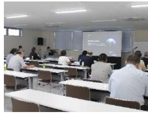
9/9 生活用品部会勉強会 ネクストミーツ株式会社