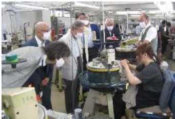
7/12 繊維衣料部会視察会 株式会社ウメダニット

■部会員の交流と連携の促進を目的に勉強会、視察会を開催。💡 11部会合計で延べ 1,075 名が参加(700 名)