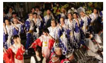
8/1 平和祭 センバツ大民踊流し

■3年ぶりに大手通周辺で開催。ハーレーダビッドソン、バントワーリング、消防音楽隊のパレードのほか、悠久太鼓、センバツ大民踊流し、越後長岡慰霊神輿渡御が会場を盛り上げた。来場者数 35,000 名