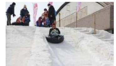
2/18・19 雪しか祭り スノー滑り台

■雪を活用した家族で楽しめる冬のイベントとして、コロナ禍前の行事内容に加えて、新たに若者を中心とした市民団体とも連携して開催。来場者数 29,000 名(2 日間)