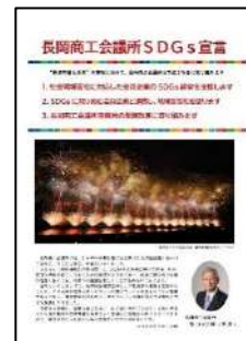
長岡商工会議所SDGs宣言