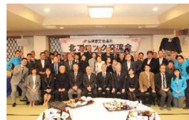
3/8 北ブロック交流会