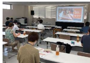
6/28 第2回創業者クラブ