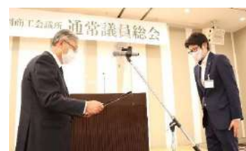
令和3年度新会員募集で24件を勧誘した青年部を表彰(6/10 通常議員総会)