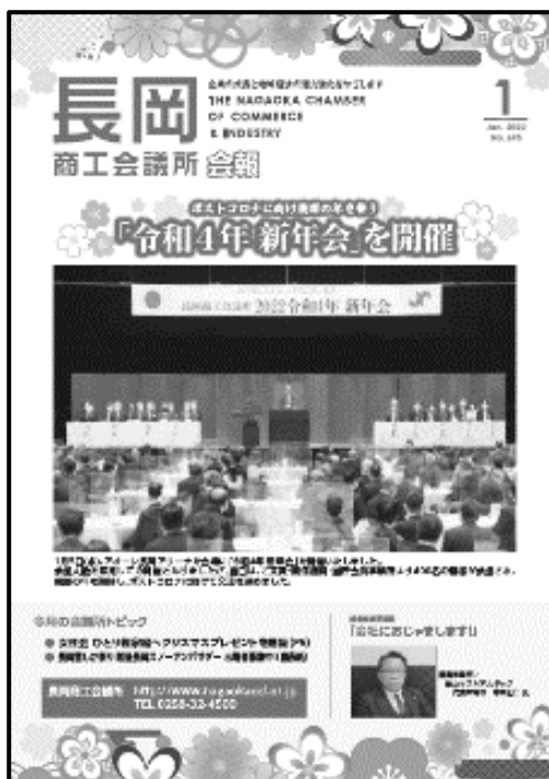
会報はA4サイズです