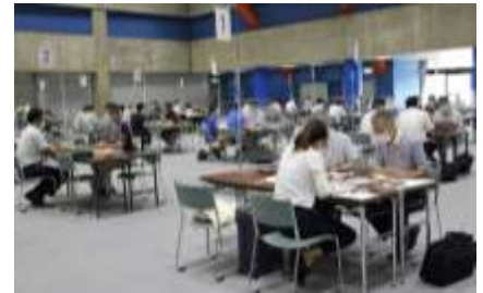
ビジネスマッチング個別商談会の様子