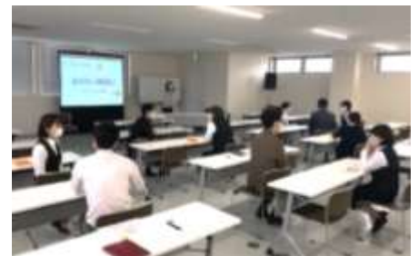
働き方改革に向けた職員研修