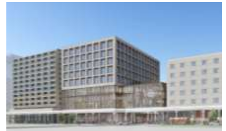
地方創生の拠点「米百俵プレイス」 整備イメージ図