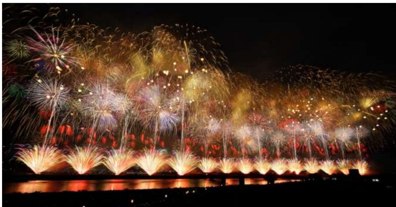
長岡まつり大花火大会：復興祈願花火フェニックス

長岡商工会議所では、3か年の中期計画である第13次行動計画に合わせて新たに「SDGs宣言」を策定いたしました。