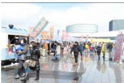
屋外での出店の様子