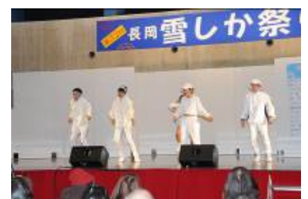
ソング&ダンスアワード