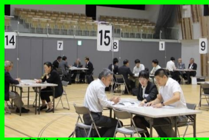
<商談イメージ(第3回の様子)>