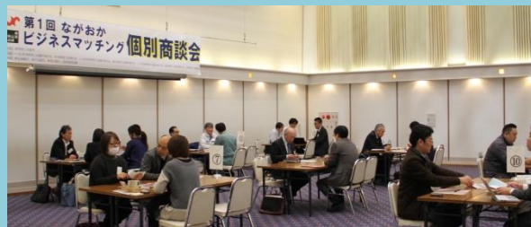
<商談イメージ(第1回の様子)>