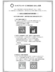
▲1月にSDGs宣言し、社員の意識づけを実行中