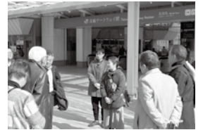
▲2/18(水)建設部会 視察会