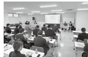
▲2/27(金)食品部会 NICO事業説明会