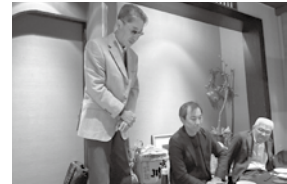
▲2/13(金)繊維衣料部会 新年会