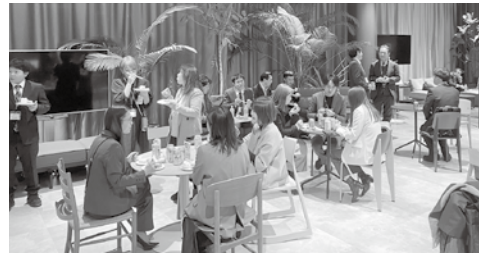
▲米百俵プレイスを会場に開催した交流会