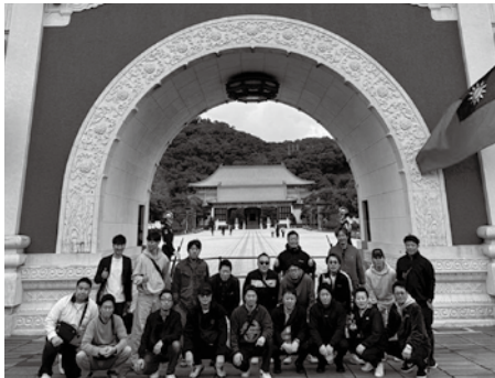
▲忠烈祠での集合写真