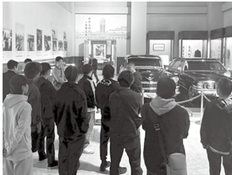
▲中正紀念堂での様子

2月6日(金)～9日(月)に海外研修事業を実施し、台湾の総督府・中正紀念堂・九份などを訪問しました。歴史・文化・経済交流を体感し、日本と台湾の活発な歴史背景を理解することで、地域づくりや事業の発展など地域活動に活かせる学びの場となりました。また、4日間ともに学び、交流を深めたことで、メンバー同士の繋がりがより強くなりました。(参加者23名)