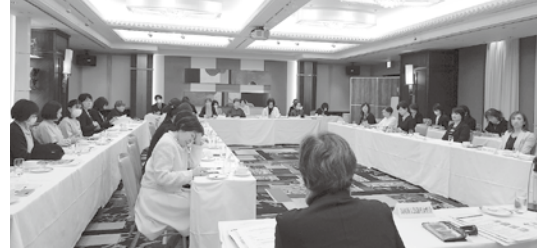
▲正副会長会議の様子