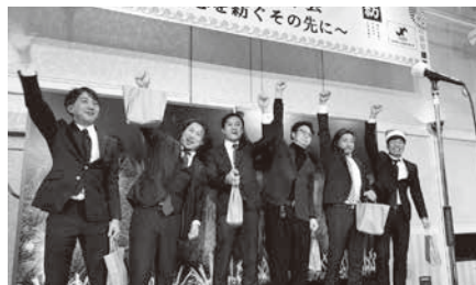
▲アトラクション優勝チームへ景品贈呈