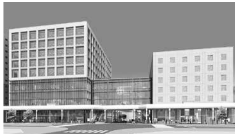
米百俵プレイスマイリエ長岡 フルオープンイメージ (2026年秋予定)

現在、日本社会は、加速する人口減少・少子高齢化、物価高騰による実質賃金の低下、公共施設の老朽化、デジタル社会への対応など、歴史的な転換期にあります。地域の活力を維持し、安全安心なまちを築くためには、従来の発想にとらわれない取り組みが必要です。来年度、今後10年間のまちづくりの方向性を示す次期長岡市総合計画がスタートします。この大きな転換期に、「長岡版イノベーション」と、行財政改革を着実に推し進め、皆様の事業活動を力強く支えることで、人や企業に「選ばれるまち長岡」を実現してまいります。