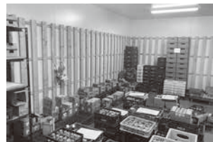
「銀座(笑)のように明るくなった冷蔵庫」