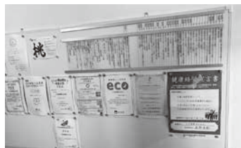
SDGs、健康経営のポスターや認定書