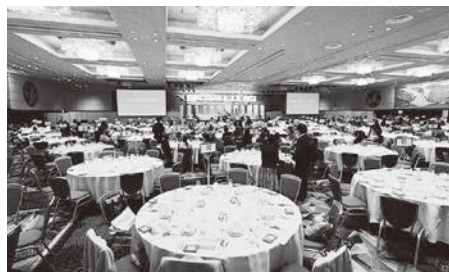
▲ メイン会場の様子

10月10日(金)ホテルニューオータニ東京で開催された全国商工会議所女性会連合会表彰授賞式において、当女性会は組織強化(会員増強)表彰を受賞。当日は全国各地から1,360名が参加し盛大な大会となりました。(当会参加者3名)