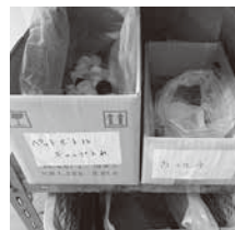
「出来る事から始める」 私たちのSDGs