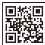
▲ホームページを 今すぐチェック!

100円・800円などの税込みポッキリ価格でお買い物ができるポキパス。いろいろなお店を回遊して、お得に買い物やサービスを楽しんでください!